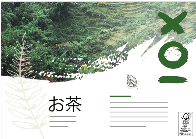
Colocación de la etiqueta FSC®: anverso abajo a la derecha

Etiqueta FSC® (31 x 49 mm) La etiqueta FSC® tiene alrededor un espacio blanco de 2 mm. Seleccione si la etiqueta FSC® debe colocarse en la parte delantera, trasera, inferior izquierda o inferior derecha.